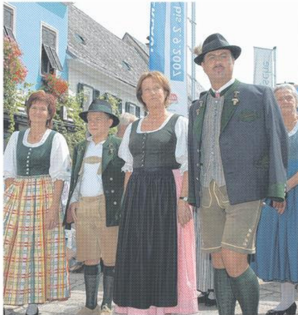
Schilchertage. Unzählige Besucher lockten auch die 23. Schilchertage nach Stainz. Edle Tröpferl und Kulinarisches standen im Mittelpunkt. Ein Höhepunkt war auch der Trachtensonntag. AST

Unnötige Verkehrstafeln werden in Gamlitz und Halbenrain gnadenlos entfernt